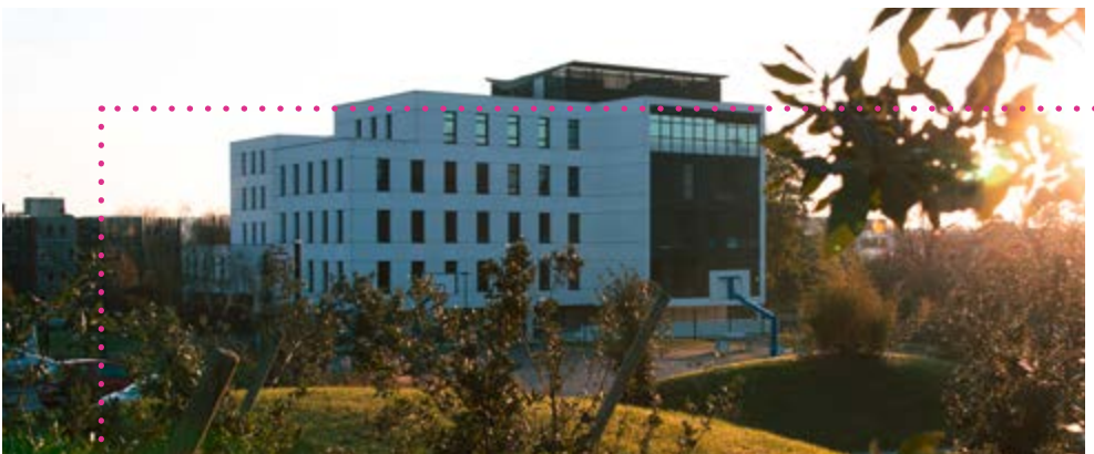
CAMPUS DE RENNES

Mettre en application ces travaux de recherche via des partenariats au sein des entreprises permet de répondre à leurs problématiques concrètes.