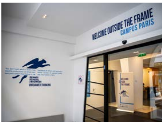
CAMPUS DE PARIS